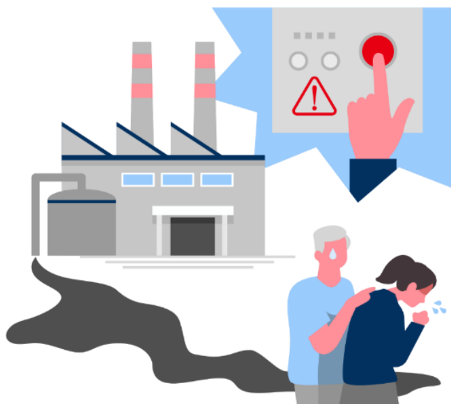
汽车零部件企业中的非法废水排放