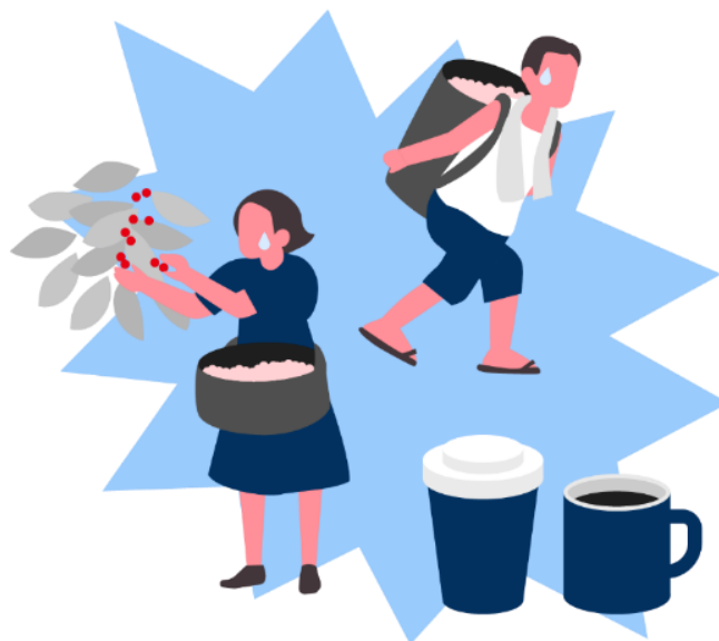
危地马拉咖啡种植园中的童工