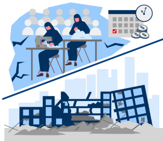
孟加拉国成衣工厂中的建筑倒塌事故