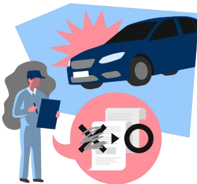
汽车零部件企业中的安全部件缺陷与质量违规