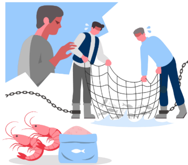
养殖虾饲料（鱼粉）供应链中的强迫劳动（捕捞渔船）