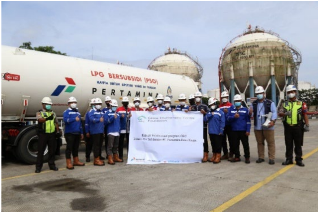
【LPG スキッドタンク車両前全体写真】