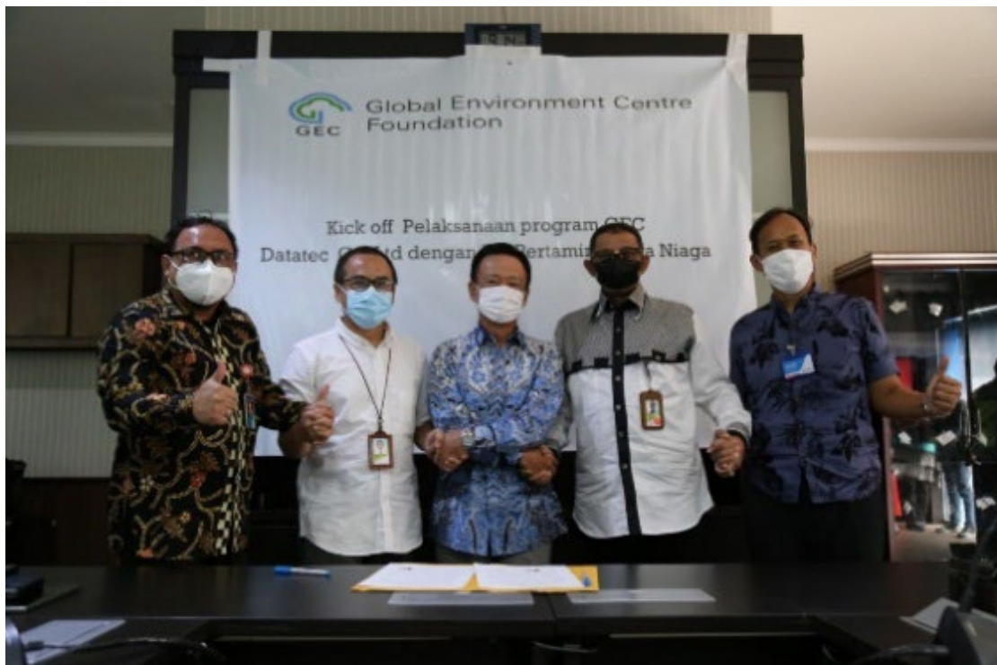
【プルタミナとの調印式の様子】