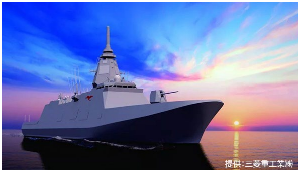
豪州次期汎用フリゲートのイメージ

豪州政府は GPF を 11 隻導入する計画であり、三菱重工業(株)との契約はこのうち最初の 3 隻を日本国内にて建造するもので、1 番艦は 2029 年 12 月に豪州側に引き渡されます。4 隻目以降は、西豪パース近郊のヘンダーソン造船所にて現地建造されることが予定されています。